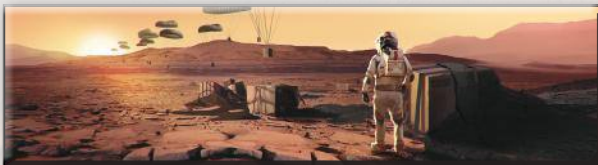
«Поставка снабжения» (Гарретт Каида)

Этот вариант игры можно использовать с любыми дополнениями. Теперь, вместо того, чтобы увеличивать глобальные параметры, ваша цель — повысить свой РТ до 63 за 14 поколений (или за 12, если вы играете с картами прологов). Пометьте 63-е деление золотым кубиком. В этом варианте игры добавляется новый стандартный проект «Буферный газ», который стоит 16 М€ и повышает ваш РТ на 1. В остальном действуют обычные правила игры в одиночку.